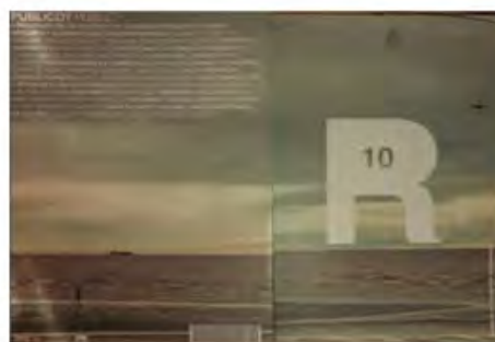
3 Portadas de Revista de la Facultad de Arquitectura N 1, 9 y 10.